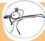
STERNE NAINE un brin râleuse mais fidèle copine