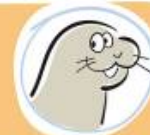
PHOQUE VEAU MARIN compagnon tranquille, philosophe à ses heures