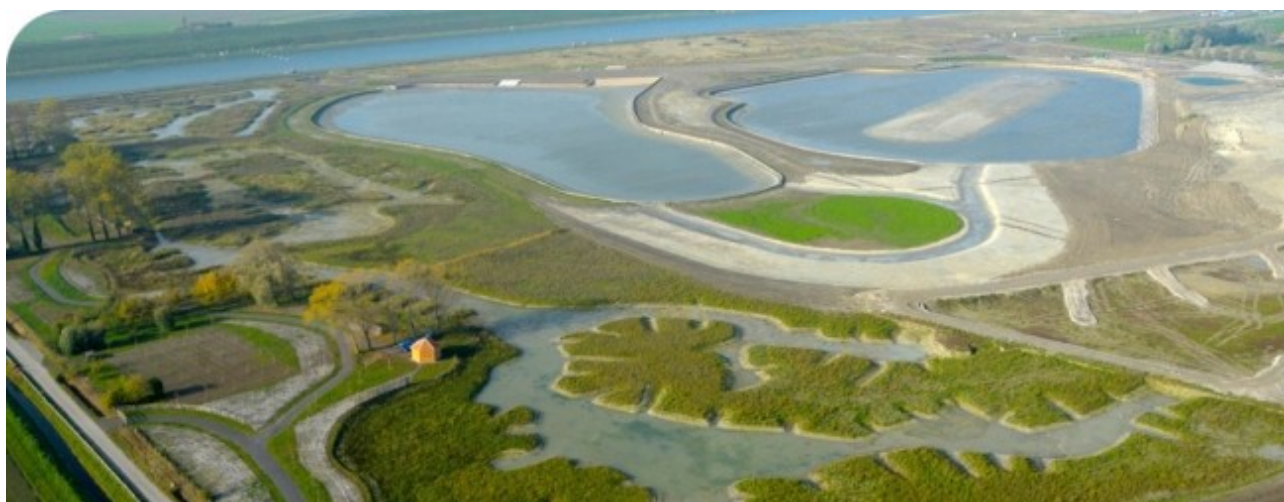
Happy Day - JL Burnod

diverses diodes. Si un problème survient en exploitation, une fuite par exemple, une alarme va immédiatement se déclencher. Et le tableautiste présent saura exactement où le problème a été détecté pour y répondre au plus vite », expliquent-ils. « Notre travail actuel consiste à superviser l'installation de toute l'instrumentation électronique qui permettra à cet écran de gérer l'ensemble du terminal. C'est un travail long et délicat. Il y a beaucoup de paramètres à intégrer, comme les flux, le niveau, la température et la pression, puis on analyse et on corrige ce qui doit l'être pour être sûr que les données enregistrées soient les bonnes », résumant-ils. « On ne peut pas se tromper ». Les deux superviseurs vont encore rester plusieurs mois à Loon-Plage. Ils vont, en effet, accompagner Gaz-Opale, l'exploitant du terminal, pendant quelques semaines, après que le terminal soit entré en phase d'exploitation.