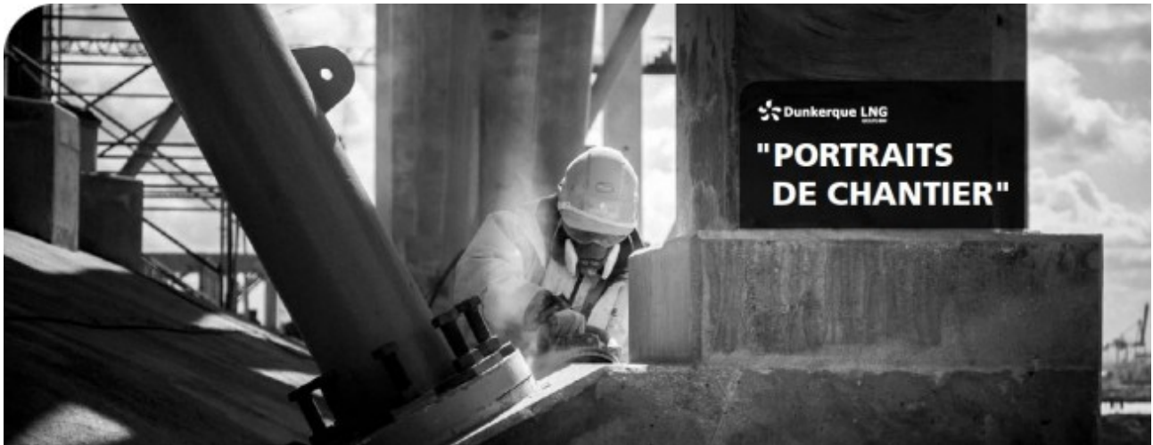
Adrien Fouliard - Happy Day